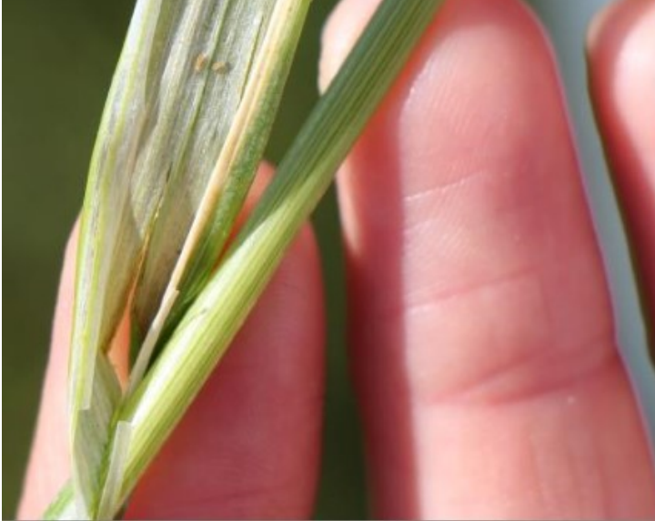
Billede 3. To larver af trips i bladskede.