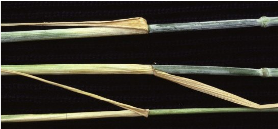
Billede 4. Brunfarvede faneblade og bladskeder efter tripsangreb.