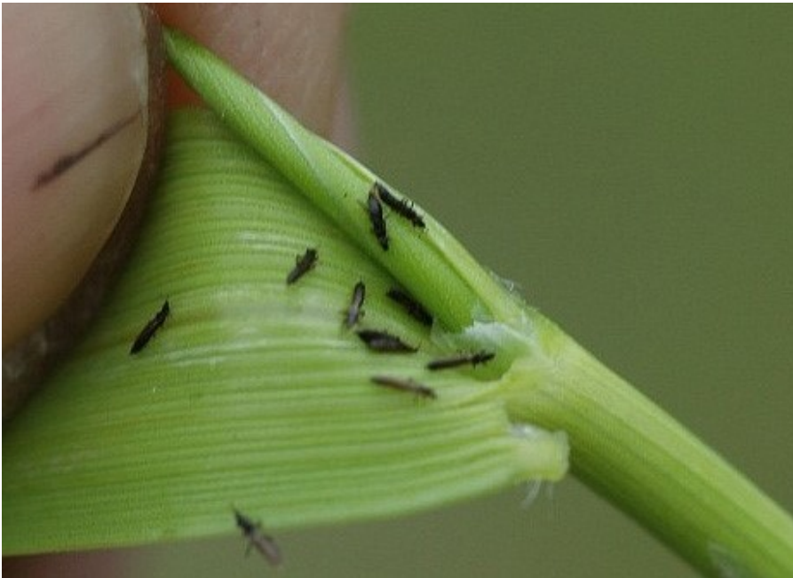
Billede 1. Trips i triticale.

Se svenske forsøg med baggrund for bekæmpelsestærsklerne i vintersæd i Artikel 1746 .