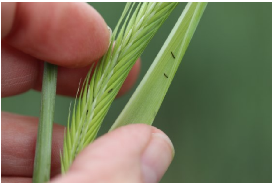
Billede 2. Trips i udfoldet bladskede i rug.